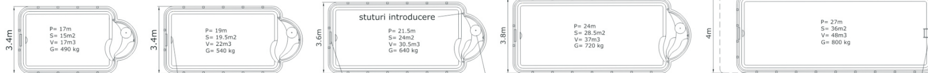
GOLF S 10x4 R

proiector subacvatic (poate fi amplasat in diverse pozitii)